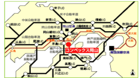
コンベックス岡山の無料駐車場