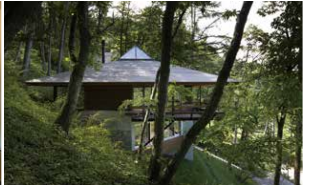
使用写真(左から) / 設計:河川佳介/ 設計:岡本一真/ 設計:山本学