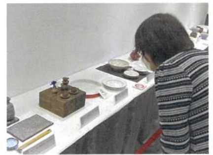
当日の展示風景（昨年開催より）